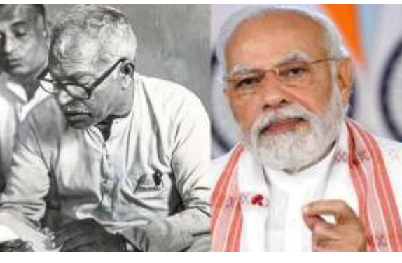
இது குறித்து சமூக பதிவில் ரத்னா கர்பூரி கூறியிருப்பதாவது: தாசூரின் பிறந்த நாளை முன்னிட்டு பிரதமர் மரியாதை முதலமைச்சர் பாரத

சென்னை, 25 ஜனவரி 2025: கார் மாநிலத்தின் முன்னாள் முதலமைச்சர் பாரத ரத்னா கர்பூரி தாசூர் அவர்களின் பிறந்த நாளை முன்னிட்டு பிரதமர் திரு நரேந்திர மோடி அவருக்கு மரியாதை செலுத்தியுள்ளார்.