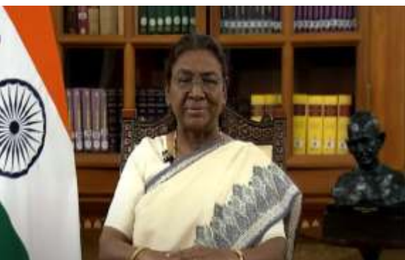
மொழிகளில் குடியரசுத் தலைவரின் உரை ஒலிபரப்புகும்.

சென்னை, 25 ஜனவரி 2025: குடியரசு தினத்தை முன்னிட்டு, குடியரசுத் தலைவர் திருமதி திரைபதி முர்மு 2025 ஜனவரி 25 நாட்டு மக்களுக்கு உரையாற்றுகிறார். இந்த உரை இரவு 7.00 மணியில் இருந்து ஒலிபரப்பப்படும். தேசிய அளவிலான ஆகாசவாணி அலைவரிசைகளில்