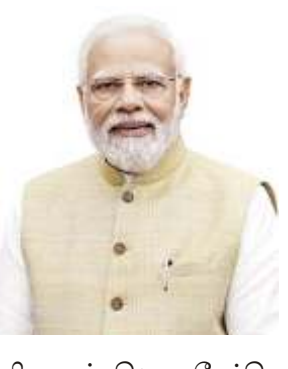
பிரதமர் திரு நரேந்திர மோடி

சென்னை, 25 ஜனவரி 2025: அயர்லாந்து பிரதமராகப் பொறுப்பேற்றுள்ள திரு மைக்கேல் மார்ட்டினுக்கு பிரதமர் திரு நரேந்திர மோடி வாழ்த்துத் தெரிவித்துள்ளார்.