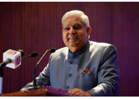
உரையாற்றிய குடியரசு துணைத்தலைவர் திரு. ஜகதீப் தன்கர்.

சென்னை, 25 ஜனவரி 2025: கர்பூரி தாசூர் சமூக நீதியின் காவலராகத் திகழ்ந்தார் என்றும், அவர் இடஒதுக்கீட்டை அமல்படுத்தி, ஏராளமான மக்களுக்கு வாய்ப்புகளை உருவாக்கித் கொடுத்தார் என்றும் குடியரசு துணைத்தலைவர் திரு. ஜகதீப் தன்கர் கூறினார்.