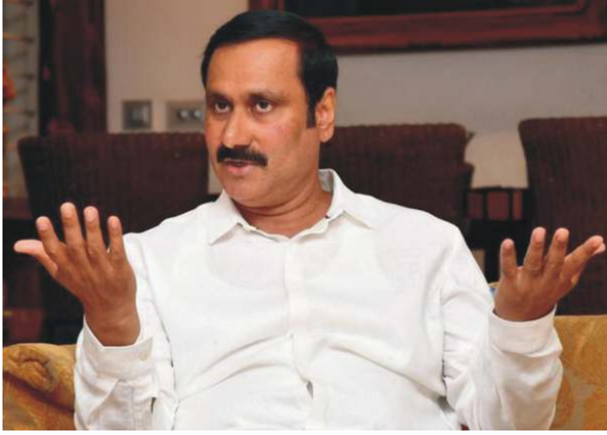
மத்தியில் காங்கிரஸ் மேகதாது அணை கட்டப்படும் என்று மத்திய அரசின் தவறாகவும், ஆட்சி அமைந்தால் கட்டப்படும் என்று மத்திய அரசின் தவறாகவும்,