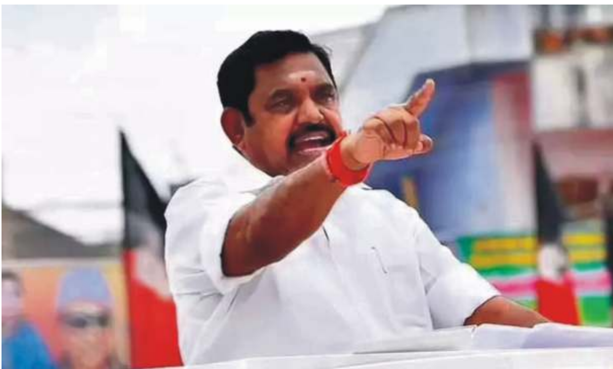
இல்லை என முடிவு செய்த காவிரி மேலாண்மை ஆணைய அறிவித்தாலும் தலைவர் நிகழ்ச்சிக் மேகதாதுவில் குறிப்பில் வேறு மாதிரி தமிழ்நாடு ஒப்புதலின்றி எழுதிவிட்டார். அணை கட்ட மேகதாது அணை விவகாரத்தில் மேல் நடவடிக்கைக்காக ஒன்றிய அரசின் நீர்வளத்துறை ஆணையத்துக்கு அறிக்கை அனுப்பிவைப்பதாக கூறியது தன்னிச்சையானது. தமிழ்நாட்டின் ஒப்புதலை பெறாமல் ஒரு செங்கலை கூட கர்னாடகா எடுத்து வைக்க முடியாது. கர்னாடகத்தில் எந்தக் கட்சி ஆட்சியில் இருந்தாலும் அரசியலுக்காக அமைச்சர் பிரச்சனையை விளக்கத்தை ஏற்க பேசுகிறார்கள். மறுத்து அண்ணா தி.மு.க. கர்னாடக எம்.எல்.ஏ.க்கள் சட்டப்பேரவையில் வெளிநடப்பு செய்தனர். முன்னதாக சட்டப்பேரவையில் இந்த பிரச்சினை தொடர்பாக கவன ஈர்ப்பு வந்து கொண்டிருக்கிறது. எதிர்க்கட்சித் தலைவர் எடப்பாடி பழனிசாமி பேசியதாவது: காவிரி மேலாண்மை ஆணையத் தைக் கண்டித்து சட்டப் பேரவையில் தீர்மானம் நிறைவேற்றி இருக்க வேண்டும். தமிழ்நாடு அரசு அலட்சியத்தின் காரணமாக 50 ஆண்டுக் காலம் போராடி பெற்ற தீர்ப்புக்கு குந்தகம் ஏற்பட்டு விடும் என அச்சம் எழுந்துள்ளது. தமிழ்நாடு அரசு உடனடியாக நடவடிக்கை எடுக்காவிட்டால், கர்னாடக அரசு மேகதாதுவில் அணை கட்டும் சூழல் உருவாகும். காவிரி நீர் மேலாண்மை இந்து விவகாரத்தில் ஆணையத்தின் செயல்பாடு தமிழ்நாடு அரசின் எதிர்ப்பை மீறி நடைபெற்றது வேதனை அளிக்கிறது. இதனால் காவிரியின் குறுக்கே புதிதாக மேகதாது அணையை கர்னாடக அரசு கட்டி விட்டால் காவிரி நீர் பாயும் தமிழ்நாட்டின் டெல்டா பகுதியில் உள்ள 20 மாவட்டங்களுக்கு காவிரி நீர் வரத்து அடியோடு நின்று போய் அந்தப் பகுதி விவசாயிகளும் பொதுமக்களும் பாதிக்கப்படுவார்கள். எங்கள் கட்சி ஆட்சியில் இருக்கிற வரை காவிரி மேலாண்மை ஆணையத்தில் சட்டசபை வளாகத்தில் தி.மு.க. அரசுக்கு எதிராக கோஷம் எழுப்பப்படாமல் மேகதாது அணையை அனுமதிக்காதே; சட்டசபையில் கண்டன தீர்மானம் நிறைவேற்று உட்பட பல்வேறு கோஷங்களை எழுப்பினார்கள்.

செய்தனர். முன்னதாக சட்டப்பேரவையில் இந்த பிரச்சினை தொடர்பாக கவன ஈர்ப்பு வந்து கொண்டிருக்கிறது. எதிர்க்கட்சித் தலைவர் எடப்பாடி பழனிசாமி பேசியதாவது: காவிரி மேலாண்மை ஆணையத் தைக் கண்டித்து சட்டப் பேரவையில் தீர்மானம் நிறைவேற்றி இருக்க வேண்டும். தமிழ்நாடு அரசு அலட்சியத்தின் காரணமாக 50 ஆண்டுக் காலம் போராடி பெற்ற தீர்ப்புக்கு குந்தகம் ஏற்பட்டு விடும் என அச்சம் எழுந்துள்ளது.