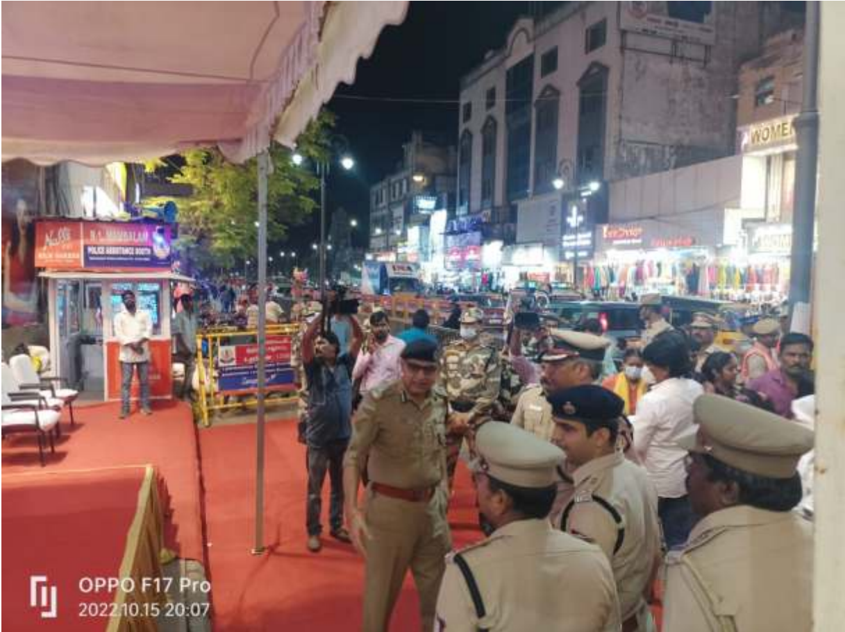
OPPO F17 Pro 2022.10.15 20:07

அமெரிக்கா, இந்தியா மற்றும் இந்தோ பசிபிக் பகுதிகளின் வர்த்தக விண்வெளி வாய்ப்புகளை இணைக்கும் சர்வதேச விண்வெளி மாநாடு சென்னையில் தொடக்கம்