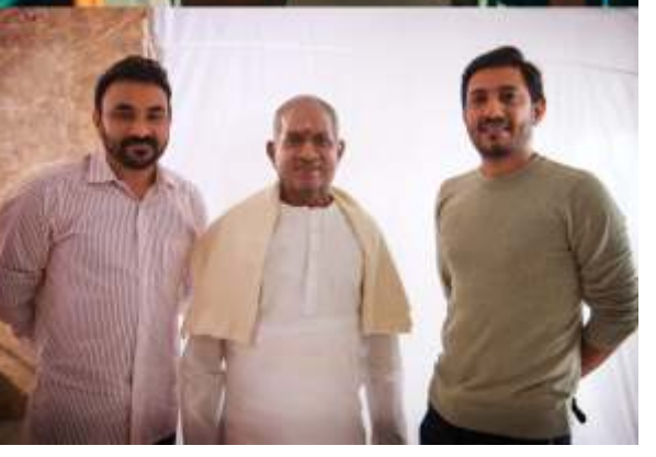
ரஹ்மான் அவர்களின் "நெஞ்சே எழு", பிரபல பின்னணி பாடகர் சித்பூராமின் "ஆல் ல் நோ ஹேட்" இசை நிகழ்ச்சி, பிரபல பாடகர் பின்னணி பாடகர்

ஹரிஹர் அவர்களின் "மடை திறந்து", மறைந்த பின்னணி பாடகர் எஸ் பி பி மற்றும் கே. ஜே. யசுதாஸ் இணைந்து சிங்கப்பூரில் "வாய்ஸ் ஆப் லெஜெண்ட்", பிரபல பின்னணி பாடகர்கள் ஸ்ரீனிவாஸ், விஜயபிரகாஷ் அவர்களின் "மடை திறந்து", ராக் வித் ராஜா இன் "வாய்ஸ் ஆப் லெஜெண்ட்" எனும் நிகழ்ச்சிகளை நடத்தி இசை ரசிகர்களின், மனதை வருடிச்செல்வ வைத்தது. அது மட்டுமல்லாமல் சமீபத்தில், தமிழ்நாடு சுற்றுலா வளர்ச்சி கழகம் மற்றும் தமிழக கலை மற்றும் பண்பாட்டுத்துறை யுடன் இணைந்து "நம்ம ஊர் திருவிழா" நிகழ்ச்சியும் மற்றும் பிரமாண்டமான "லெஜெண்ட்" திரைப்பட ஆடியோ வெளியீட்டு விழா போன்ற நிகழ்ச்சிகளையும் நடத்தியவர்கள் என்பது குறிப்பிடத்தக்கது.