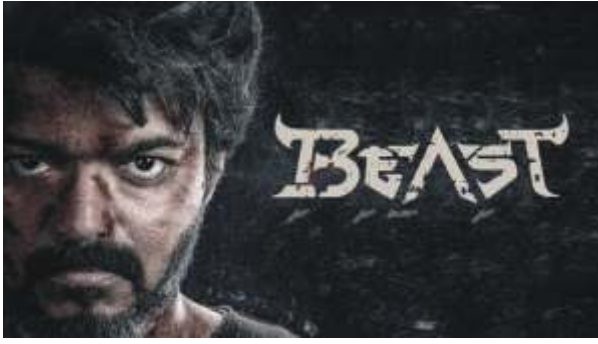
இந்த நிலையில் குவைத் தடை விதித்துள்ளதாக அரசு விஜய் நடிகை பீஸ்ட் படத்திற்கு திடீரென இந்த படத்தில் பாகிஸ்தான்

சென்னை, ஏப்ரல் 06 2022: விஜய்யின் பீஸ்ட் படத்திற்கு குவைத் நாட்டில் தடை விதித்து உத்தரவிடப்பட்டுள்ளது. விஜய் நடிகை பீஸ்ட் திரைப்படம் இம்மாதம் 13ஆம் தேதி உலகம் முழுவதும் திரையரங்குகளில் வெளியாக உள்ளது. சன் பிக்சர்ஸ் சார்பில் தயாரிக்கப்பட்டுள்ள இந்தப் படத்தின் புரமோஷன் பணிகள் விறுவிறுப்பாக நடைபெற்று வருகின்றன.