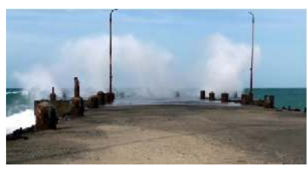
மேலும் தொடர்ந்து கடல் சீற்றத்துடன் கண்படுகிறது. வேலி அமைத்து தடுத்து இந்த பகுதியில் மீனவர்கள் மீன்பிடிக்க செல்ல மீன்வளத்துறையினர் தடை விதித்துள்ளனர்.

இதனால் தனுஸ்கோடிக்க சுற்றுலா பயணிகள் மற்றும் மீனவர்கள் செல்ல தடை விதிக்கப்பட்டதுடன் சுற்றுலா பயணிகள் புதுரோடு பகுதியில்