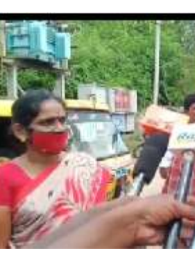
அளித்து அதற்கு இடைக்கால தடை என்று கூறி ஆவணங்கள் சரி பாரக்காமல் பதவியை தவறாக பயன்படுத்தி அரசு