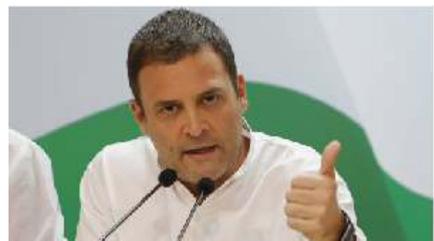
தெரிவித்துள்ளார். மோடியும், அமிதஷாவும் இந்தியர்களுக்கு எதிராக போகாமல் உளவு மால்வேரை பயன்படுத்தியதாக குற்றம் சாட்டியுள்ளார்.

இந்நிலையில், செய்தியாளர்களுக்கு இன்று பேட்டியளித்த ராகுல்காந்தி, ஒட்டுக்கேட்டி விவகாரத்திற்கு பொறுப்பேற்று உள்துறை அமைச்சர் அமிதஷா பதவி விலக வேண்டும். எனது செல்போனையும் பெகாஸ் மால்வேர் மூலம் உளவு பார்க்கப்பட்டு உள்ளது. இந்த நிலையில், செல்போன் உளவு பார்க்கப்பட்ட விவகாரத்தை கண்டித்து, இன்று நாடாளுமன்ற வளாகத்தில் காங்கிரஸ், திமுக