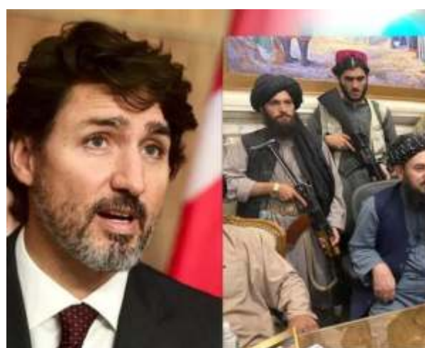
எங்களிடம் இல்லை. தலிபான்கள் அறிவிக்கப்பட்ட பயங்கரவாத குழுக்கள். ஆப்கானிஸ்தானில் அகப்பட்டிருக்கும் மக்களை அங்கிருந்து வெளியேற்றுவதுதான் பிரதான நோக்கம்" என்றார்.

கோவை, ஆகஸ்ட் 19 2021: கோவை சிங்காநல்லூர் பத்திரப்பதிவு அலுவலகம் இடம் மாறும் செய்வதை தடுத்து நிறுத்த வலியுறுத்தி சிங்காநல்லூர் பொதுமக்கள் 5011 கையெழுத்துக்களை பெற்று தமிழக முதல்வர், தலைமைச் செயலாளர், இடத்தையும் ஒதுக்கி தர கோட்டிருந்தனர். கோவை விமான நிலையம் மற்றும் இரயில் நிலையத்திற்கு அருகிலுள்ள வசதியான இடத்தை ஒதுக்கி தருமாறு பல்வேறு மனுக்களை கடந்த ஆட்சி காலத்தில் அப்பகுதி பொதுமக்கள் அனுப்பி இருந்தனர். ஆனால் தற்போது பொதுமக்கள் மற்றும் அப்பகுதியில் பணிபுரியும் ஆவண எழுத்தர்கள் கோரிக்கைகளை பரிசீலிக்காமல், வெள்ளலூர் சார்பிதவாளர் அலுவலகம் கிராம எல்லைக்கு உட்பட்ட பகுதியில் திருச்சி ரோடு, பாப்பம்பட்டி பிரிவு முதல் ராமநாதபுரம், அல்வேனியா கான்வென்ட் வரையில் உள்ள ஏதேனும் ஒரு இடத்தில் இதை அலுவலகத்தை மாற்றுவதற்காக பல்வேறு முயற்சிகள் நடைபெற்றது. இதையடுத்து சிங்காநல்லூர் சார்பிதவாளர் அலுவலகம் கிராம எல்லைக்கு உட்பட்ட பகுதியில் சிங்காநல்லூர் பத்திரப்பதிவு அலுவலகம் அமைக்கக் கட்டிட பணிகள் நடைபெற்று வருகிறது. தற்போது உள்ள கொரோனா நோய்த்தொற்று காலத்தில் சிறிய அளவிலான கட்டிடத்திற்கு சிங்காநல்லூர் சார்பிதவாளர் அலுவலகத்தை அமைக்க மாற்றம் செய்தால் பொது