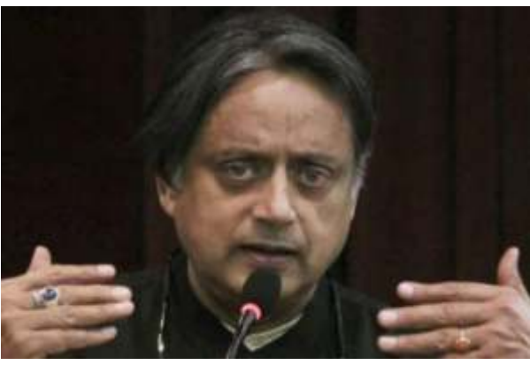
வருடமாக தன்னை போலீசார் விடுதலை அளிப்பது வந்ததாகவும் திடீர்த் திருப்பதாகவும் இப்போது அதில் இருந்து தெரிவித்துள்ளார்.