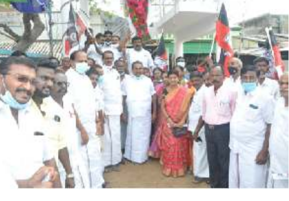
பொருப்புகளில் உள்ள கழக கலந்து கொண்டனர். நிர்வாகிகள் ஏராளமானோர்