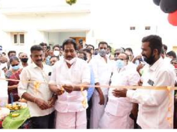
மதுரை: மதுரை கிழக்கு சட்டமன்ற தொகுதிக்கு உட்பட்ட ஆலாத்தூர் ஊராட்சி கே.பி. கார்டனில் புதிய மின் மாற்றியினை (டிபான்ஸ்பார்மர்) வணிகவரி மற்றும் பதிவுத் துறை அமைச்சர் மூர்த்தி துவக்கி வைத்தார்.

பள்ளிகளுக்கு வாகனங்களில் சென்று சேர்க்க செலவின தொகை வழங்கப்பட்டு வரும் நிலையில், தற்போது விழுப்புரம் மாவட்டத்தில் அந்தந்த பள்ளிகளின் தலைமை ஆசிரியர்கள் தங்களது சொந்த செலவில் பாட புத்தகங்களை கொண்டு செல்லும் நிலை உள்ளது. இதுதான் கட்டணக் காலங்களைப் போல் வேண்டுமென கோரிக்கை வைக்கப்பட்டு வருவது.