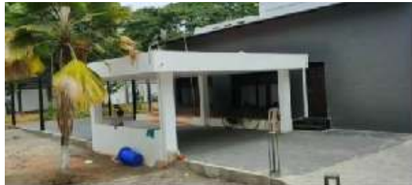
கோவை, ஆகஸ்ட் 14 2021: கோவை மாநகராட்சி தலைமை பொறியாளர் இல்லத்தை கே.சி.பி இன்ஜினியரிங் நிறுவனம் புணரமைப்பு செய்து கட்டுமான பொருட்கள் வாங்கிய பில்கள் வெளியாகி உள்ளது.

அரசு கட்டிடங்களை வழக்கமாக பொதுப்பணித்துறையே சரி செய்து கொடுக்கும் நிலையில் கே.சி.பி நிறுவனம் மாநகராட்சி அதிகாரிகளின் அரசு குடியிருப்பை நவீன வசதிகளுடன் புணரமைப்பு செய்து கொடுத்துள்ளது.