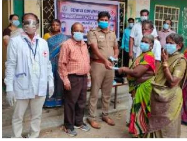
விக்கிரவாண்டி, ஆகஸ்ட் 14 2021: விழுப்புரம் கல்வி மாவட்ட ஜே.ஆர்.சி., சார்பில் ஜெனீவா ஒப்பந்த தின விழா உறுதிமொழி ஏற்பு நிகழ்ச்சி நடந்தது.