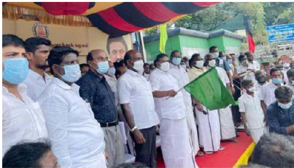
அமைச்சர் ராஜகண்ணப்பன் நடவடிக்கை எடுத்தார். அதன்படி சென்னையில் நேற்று 30 பஸ் போக்குவரத்து புதியதாக

மீண்டும் இயக்க வேண்டும் என்று கோரிக்கை எழுந்தது. காஞ்சிபுரம், செங்கல்பட்டு, திருவள்ளூர் மாவட்டங்களில் இருந்து சென்னைக்கு பஸ்களை மீண்டும் இயக்க வேண்டும் என்று அரசுக்கு கோரிக்கை வைத்தனர். அதே நேரத்தில் சென்னை புறநகர் பகுதிகளை இணைக்க கூடுதலாக புதிய வழித்தடங்களிலும் பஸ்களை இயக்க வேண்டும் என்று அமைச்சர்கள் மா.சுப்பிரமணியன், ராஜகண்ணப்பன், சேகர்பாபு ஆகியோரிடம் பொதுமக்கள் வலியுறுத்தினார்கள். அதன் அடிப்படையில் புதிய வழித்தடங்களில் மட்டுமின்றி ஏற்கனவே நிறுத்தப்பட்ட பஸ்களையும் இயக்க போக்குவரத்து துறை