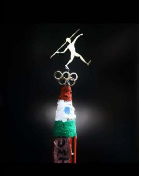
செதுக்கியுள்ளார். இவரது இந்த சிற்பம் மக்களிடையே பெரும் பாராட்டுகளை பெற்றுள்ளது.

இதனிடையே, தனது மகிழ்ச்சியை வெளிப்படுத்தும் வகையில் யு.எம்.டி. ராஜா 100 மில்லி கிராம் அளவிளான தங்கத்தில் நீரஜ் சோப்ரா ஈட்டி எறிவது போல் சிற்பத்தை