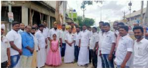
கவுண்டர் பி.ஜே.பி பொறுப்பாளர்கள் சமூக நிர்வாகிகள் மற்றும் ஏனைய கட்சி நிர்வாகிகள் மாவட்ட பொறுப்பாளர்கள் நகர இடைவெளியை பின்பற்றி கலந்து கொண்டனர்.