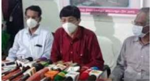
இழந்த இரண்டு பேருக்கு தலா ரூ.2 லட்சம் மதிப்பீட்டில் போட்டரியால் செயல்படும் செயற்கை கால்களையும் வழங்குகிறார். குளகிரியில் முதல்வர் தொடங்கி வைத்தும் தமிழகம் முழுவதும் இந்த திட்டம் தொடங்கப்படும். முதல்வர் வருகையையொட்டி ஒரு மற்றும் கிருஷ்ணகிரி பகுதியில் பலத்த பாதுகாப்பு ஏற்பாடுகள் செய்யப்பட்டுள்ளன.

கிராமத்தில் வாழும் மக்கள் 18 கிலோ மீட்டர் தூரம் நடந்துதான் கிருஷ்ணகிரிக்கு செல்ல வேண்டும். கடந்த மாதம் மக்கள் நல்வாழ்வுத்துறை அமைச்சர் மா.கப்பிரமணியன் அந்த கிராமத்துக்கு நடந்து சென்று குறை கேட்டார். அப்போது அந்த கிராமத்துக்கு ஆம்புலன்ஸ் வசதி நிரந்தரமாக செய்து தர வேண்டும் என்று கோரிக்கை வைக்கப்பட்டது. அதுபற்றி முதல்-அமைச்சர் மு.க.ஸ்டாலின் கவனத்துக்கு மா.கப்பிரமணியன் கொண்டு சென்றார். அவர்களின் கோரிக்கையை முதல்-அமைச்சர் ஏற்றுக்கொண்டார். நானே நடைபெறும் விழாவில் அந்த கிராமத்துக்கு இலவச ஆம்புலன்ஸ் வசதியும் வழங்குகிறார். இதுதவிர ஒரு காலை