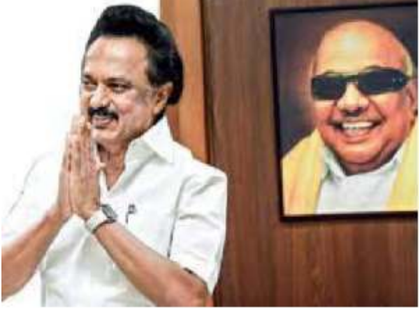
விழாவையொட்டி சில வீடுகளுக்கு முதல்-அமைச்சர் மு.க.ஸ்டாலின் நேரில் சென்று மருந்து மாதிரிகளை வழங்குவது என்ற திட்டத்தை தொடங்கி வைக்கிறார்.

இந்த திட்டத்தை தொடங்கி வைப்பதற்காக முதல் - அமைச்சர் மு.க.ஸ்டாலின் சென்னையில் இருந்து தனி விமானத்தில் ஒரு செல்கிறார். 5.25 மணிக்கு ஒரு விமான நிலையம் சென்றடைகிறார். அங்கிருந்து காரில் கிளரென்டா ஓட்டல் செல்கிறார். இரவில் அங்கு தங்குகிறார். இன்று காலை 9.30 மணிக்கு ஒரு இரண்டு குளகிரி புறப்பட்டு செல்கிறார். அந்த கிராமத்தில் விழாவுக்காக திறந்தவெளி மைதானத்தில் தேர்வடைந்து, அங்கு விழாவிடும் மக்களை தேடி மருத்துவம் என்ற திட்டத்தை தொடங்கி வைக்கிறார். தொடக்க