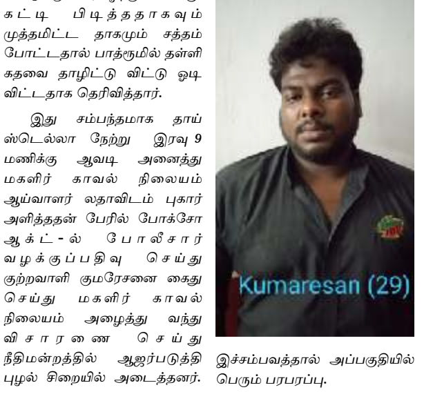
இச்சம்பவத்தால் அப்பகுதியில் பெரும் பரபரப்பு.