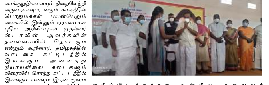
ஓட்டன்சத்திரம் தொகுதி கள்ளிமந்தயம் ஊராட்சியில் புதிய குடும்ப அட்டை வேண்டி விண்ணப்பித்த கோரிக்கைகளை அமைச்சர் அரசுக்கர்பாணி அவர்கள் கருவியாகவும், தமிழகத்தில் வாடகை கட்டிடத்தில் இயங்கும் அனைத்து நியாயவிலை கடைகளும் விரைவில் சொந்த கட்டிடத்தில் இயங்கும் எனவும், இதன் மூலம் வாடகை கட்டிடத்தில் இயங்கும் அனைத்து நியாயவிலை கடைகளும் விரைவில் சொந்த கட்டிடத்தில் இயங்கும் எனவும், இதன் மூலம் வாடகை கட்டிடத்திற்கு கொடுக்கப்படும் 618 கோடி அரசுக்கு மீதமாகும் எனவும், 10 ஆண்டுகளில் 20

திண்டுக்கல் ஆகஸ்ட் 03, 2021: திண்டுக்கல் மாவட்டம் ஓட்டன்சத்திரம் தொகுதியில் உணவு மற்றும் உணவு பொருள் வழங்கல் துறை அமைச்சர் அரசுக்கர்பாணி அவர்கள் கருவியாகவும், தமிழகத்தில் வாடகை கட்டிடத்தில் இயங்கும் அனைத்து நியாயவிலை கடைகளும் விரைவில் சொந்த கட்டிடத்தில் இயங்கும் எனவும், இதன் மூலம் வாடகை கட்டிடத்தில் இயங்கும் அனைத்து நியாயவிலை கடைகளும் விரைவில் சொந்த கட்டிடத்தில் இயங்கும் எனவும், இதன் மூலம் வாடகை கட்டிடத்திற்கு கொடுக்கப்படும் 618 கோடி அரசுக்கு மீதமாகும் எனவும், 10 ஆண்டுகளில் 20