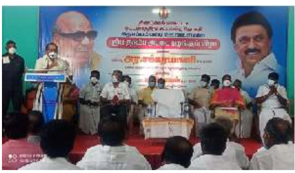
ஓட்டன்சத்திரம் தொகுதி கள்ளிமந்தயம் ஊராட்சியில் புதிய குடும்ப அட்டை வேண்டி விண்ணப்பித்த கோரிக்கைகளை அமைச்சர் அரசுக்கர்பாணி அவர்கள் கருவியாகவும், தமிழகத்தில் வாடகை கட்டிடத்தில் இயங்கும் அனைத்து நியாயவிலை கடைகளும் விரைவில் சொந்த கட்டிடத்தில் இயங்கும் எனவும், இதன் மூலம் வாடகை கட்டிடத்திற்கு கொடுக்கப்படும் 618 கோடி அரசுக்கு மீதமாகும் எனவும், 10 ஆண்டுகளில் 20

ஓட்டன்சத்திரம் ஆகஸ்ட் 03, 2021: திண்டுக்கல் மாவட்டம், ஓட்டன்சத்திரம் தொகுதி, கள்ளிமந்தயம் ஊராட்சியில் புதிய குடும்ப அட்டை வேண்டி விண்ணப்பித்த கோரிக்கைகளை அமைச்சர் அரசுக்கர்பாணி அவர்கள் கருவியாகவும், தமிழகத்தில் வாடகை கட்டிடத்தில் இயங்கும் அனைத்து நியாயவிலை கடைகளும் விரைவில் சொந்த கட்டிடத்தில் இயங்கும் எனவும், இதன் மூலம் வாடகை கட்டிடத்திற்கு கொடுக்கப்படும் 618 கோடி அரசுக்கு மீதமாகும் எனவும், 10 ஆண்டுகளில் 20