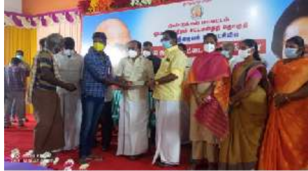
ஊராட்சி குழு உறுப்பினர் அமைச்சர் அரசுக்கர்பாணி அவர்கள் தலைமையில் ஓட்டன்சத்திரம் தொகுதி கள்ளிமந்தயம் ஊராட்சியில் புதிய குடும்ப அட்டை வேண்டி விண்ணப்பித்த கோரிக்கைகளை அமைச்சர் அரசுக்கர்பாணி அவர்கள் கருவியாகவும், தமிழகத்தில் வாடகை கட்டிடத்தில் இயங்கும் அனைத்து நியாயவிலை கடைகளும் விரைவில் சொந்த கட்டிடத்தில் இயங்கும் எனவும், இதன் மூலம் வாடகை கட்டிடத்திற்கு கொடுக்கப்படும் 618 கோடி அரசுக்கு மீதமாகும் எனவும், 10 ஆண்டுகளில் 20

ஓட்டன்சத்திரம் ஆகஸ்ட் 03, 2021: திண்டுக்கல் மாவட்டம், ஓட்டன்சத்திரம் தொகுதி, கள்ளிமந்தயம் ஊராட்சியில் புதிய குடும்ப அட்டை வேண்டி விண்ணப்பித்த கோரிக்கைகளை அமைச்சர் அரசுக்கர்பாணி அவர்கள் கருவியாகவும், தமிழகத்தில் வாடகை கட்டிடத்தில் இயங்கும் அனைத்து நியாயவிலை கடைகளும் விரைவில் சொந்த கட்டிடத்தில் இயங்கும் எனவும், இதன் மூலம் வாடகை கட்டிடத்திற்கு கொடுக்கப்படும் 618 கோடி அரசுக்கு மீதமாகும் எனவும், 10 ஆண்டுகளில் 20