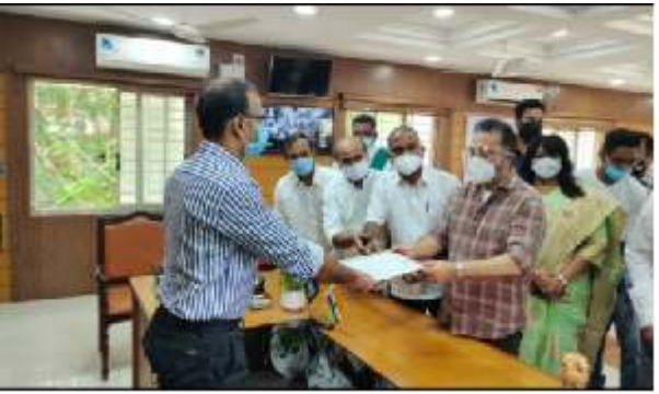
நடக்கும் என்று எதிர்பார்ப்பதாக குறிப்பிட்ட அவர், கூட்டம் கூடுவதை அரசு விரும்பவில்லை

கோவை ஆகஸ்ட் 03, 2021: இரண்டு நாள் சுற்றுப்பயணமாக கோவை வந்துள்ள மக்கள் நீதி மய்யம் தலைவர் கமலஹாசன், கோவை மாவட்ட ஆட்சியர் அலுவலகத்திற்கு வந்தார். கிராம சபை கூட்டங்களை நடத்த வலியுறுத்தி மாவட்ட ஆட்சியரிடம் மனு அளித்த அவர், தொடர்ந்து செய்தியாளர்களிடம் பேசினார். அப்போது அவர் மாவட்டம் தோறும் கிராம சபை கூட்டத்தை நடத்த