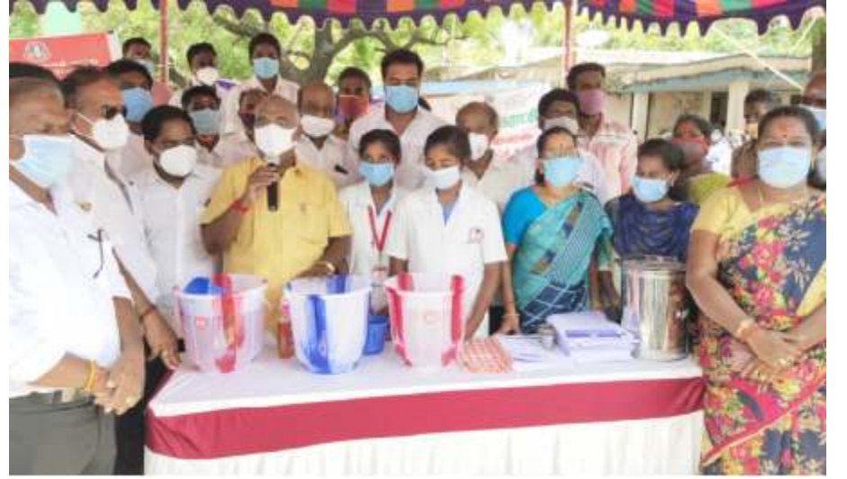
கொரோனா தடுப்புகள் முகாமம் பார்வையிட்டு கைகழுவி உறுதிமொழி ஏற்றார். அனைத்து தொடர்ந்து பொதுமக்களுக்கு கொரோனா தடுப்பு விழிப்புணர்வு துண்டுப் பிரசுரங்களை வழங்கினார். கொரோனா தடுப்புகள் முகாமம் பார்வையிட்டு கைகழுவி உறுதிமொழி ஏற்றார். அனைத்து தொடர்ந்து பொதுமக்களுக்கு கொரோனா தடுப்பு விழிப்புணர்வு துண்டுப் பிரசுரங்களை வழங்கினார். கொரோனா தடுப்புகள் முகாமம் பார்வையிட்டு கைகழுவி உறுதிமொழி ஏற்றார். அனைத்து தொடர்ந்து பொதுமக்களுக்கு கொரோனா தடுப்பு விழிப்புணர்வு துண்டுப் பிரசுரங்களை வழங்கினார்.